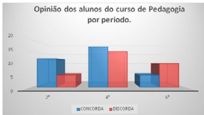
Imagem 5 - Resultado dos respondentes dos períodos do curso de Pedagogia da questão A51.

na conceituação sobre a evolução biológica, mesmo no decorrer do curso, mantendo-se uma forte influência da religião na visão dos alunos.