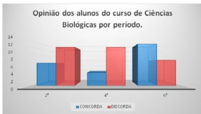
Imagem 4- Resultado dos respondentes dos períodos do curso de Ciências Biológicas da questão A51.

(BRASIL, 1999), que o ensino dos conteúdos de Biologia deve ter um cerne ecológico-evolutivo, portanto proporcionar às crianças o contato com o tema da evolução é prepara-las para conceitos mais aprofundados que deverão ser tratados em níveis de ensino posteriores.