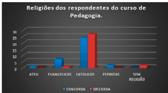
Imagem 3- Resultado das religiões dos respondentes do curso de Pedagogia da questão A51.

à religião, como a evolução biológica, e paralelamente ocorre um incremento discreto do número dos sem-religião (ateus, agnósticos e sem-religião). Esse aumento nos extremos do espectro religioso brasileiro foi notado por Silva (2015) como um gerador de conflitos em sala de aula no ensino da evolução darwiniana, quando esse autor entrevistou professores de biologia.