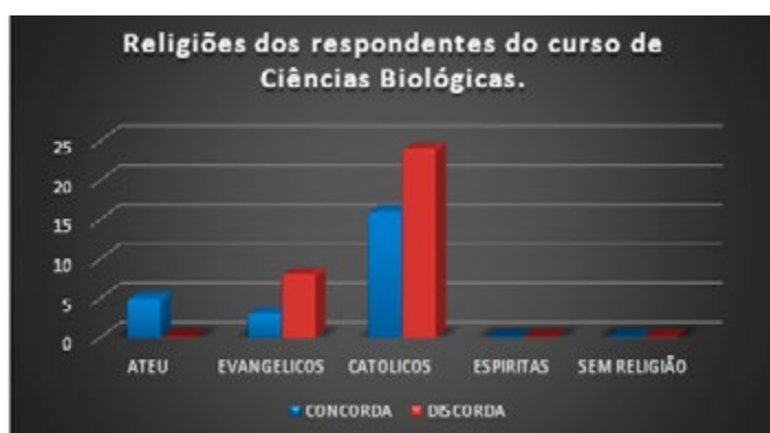
Imagem 2- Resultado das religiões dos respondentes do curso de Ciências Biológicas da questão A51.

Também foram construídos gráficos dos resultados, usando a variável religião de cada respondente dos cursos de ciências biológicas e pedagogia, em relação à concordância ou não com a afirmativa.